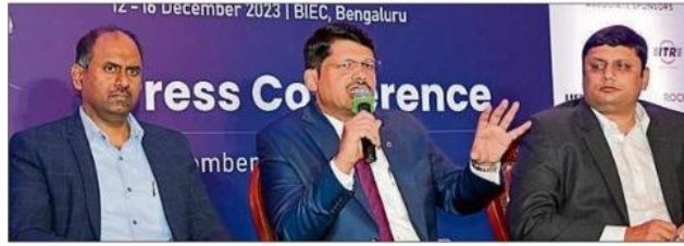
CII representatives at a press meet on the 12th edition of EXCON, in Bengaluru on Monday.