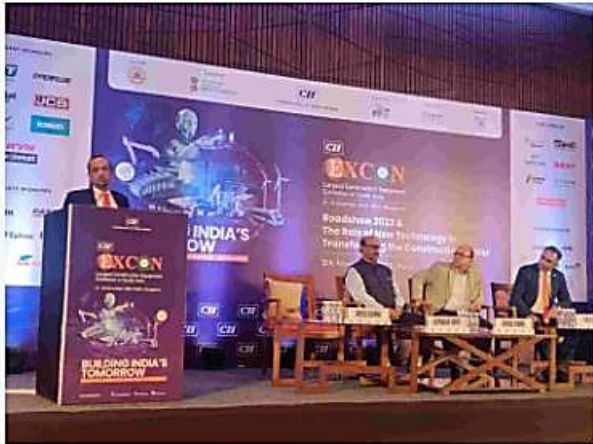
Construction Equipment Industry targets over 15% year-on-year growth in next 5 years